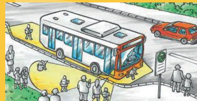
Auf den gelben Flächen wirst du NICHT GEGEHEN!