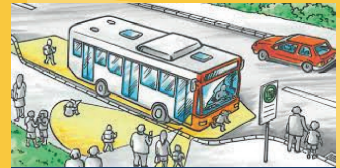
Auf den gelben Flächen wirst du NICHT GEGEHEN!